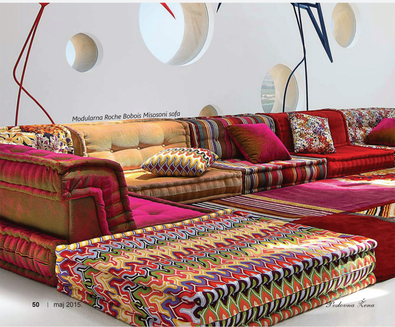
Modularna Roche Bobois Misosoni sofa

Udahnite sunčane majske dane i utonite u potpuno drugačije ambijente. Osvežite svoj prostor koktelom dizajna i mode uz neodoljive letnje ritmove vaših omiljenih bendova.