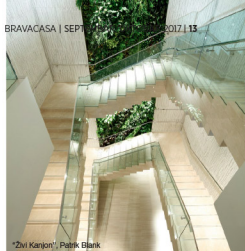
"Živi Kanjon", Patrik Blank