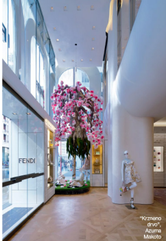
"Krzveno drvo", Azuma Makoto

ko 4000 m 2 . Ona je svečano otvorena ekskluzivnim modnim događajem kuće Dior, na kom je nova kreativna direktorka Maria Grazia Chiuri predstavila Capsule Haute Couture kolekciju za proleće/leto 2017. Za tu priliku, terasa je pretvorena u bajkoviti zeleni lavirint u kom se ističe apstraktno dizajnirano „magično drvo“. Prikazana kolekcija na moderan način oživljava staru Dior kolekciju "Jardin Japonais", koju je slavni Kristijan Dior dizajnirao opčinjen lepotom japanske tradicije.